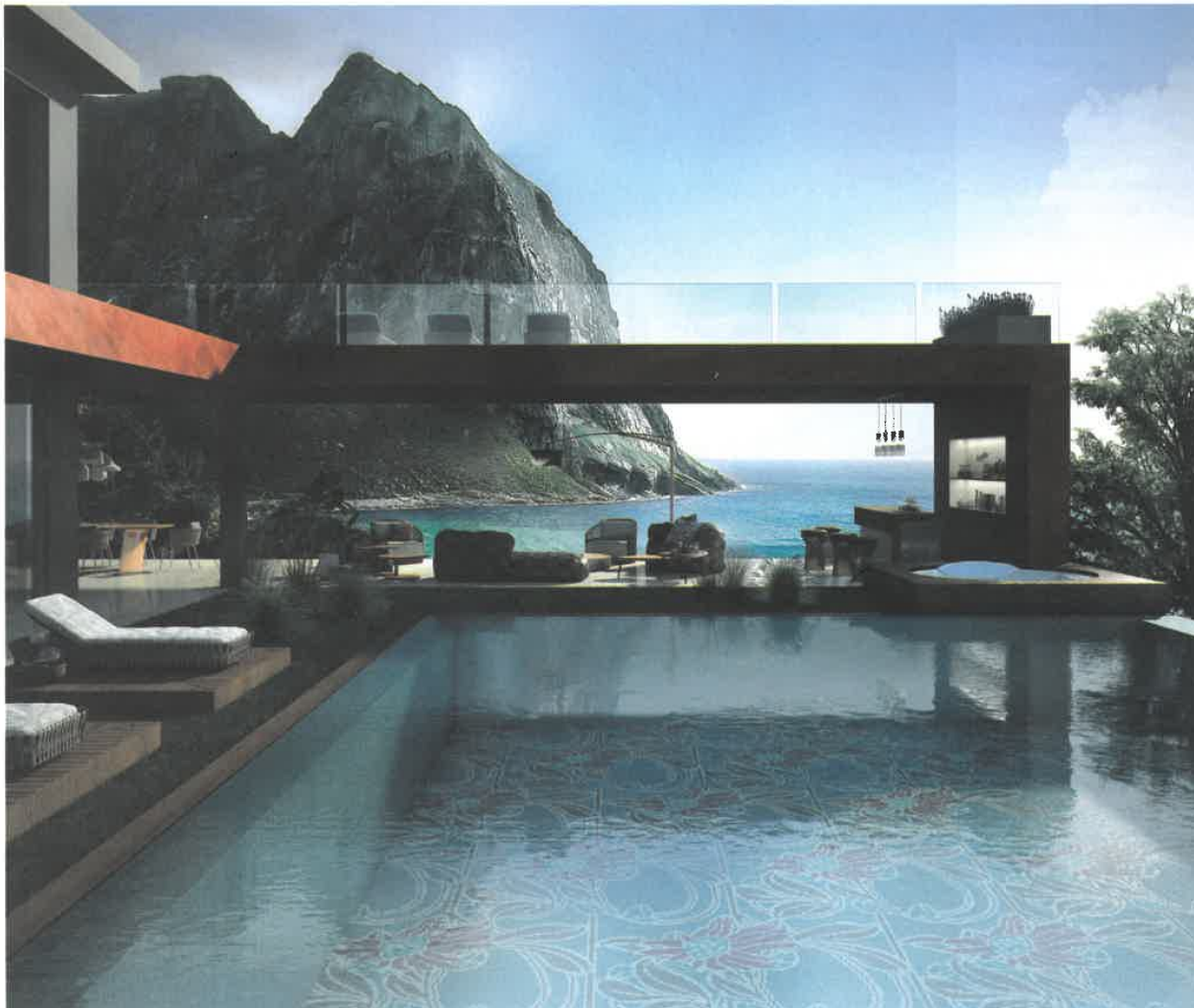
5 MOSAICO +

4 Le choix de la forme d'une piscine ne peut se dissocier du projet architectural, tout comme son aménagement extérieur. L'unité entre le bâti et l'environnement extérieur sert la cohérence harmonieuse du projet. Diffazur Piscines