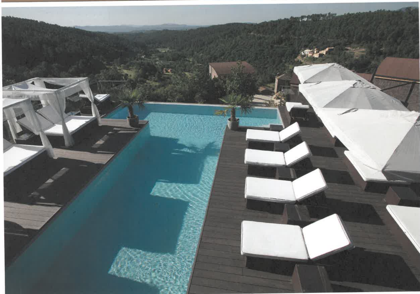
1 CARRÉ BLEU

De l'intégration parfaite de la piscine La piscine n'appartient pas au registre du consommable mais du patrimonial, d'où l'excellence qu'elle requiert en termes de conception et de réalisation avec les experts de référence. Elle participe de la valeur ajoutée « détente » de l'offre en extérieur sans se départir d'une esthétique qui sert le projet architectural.