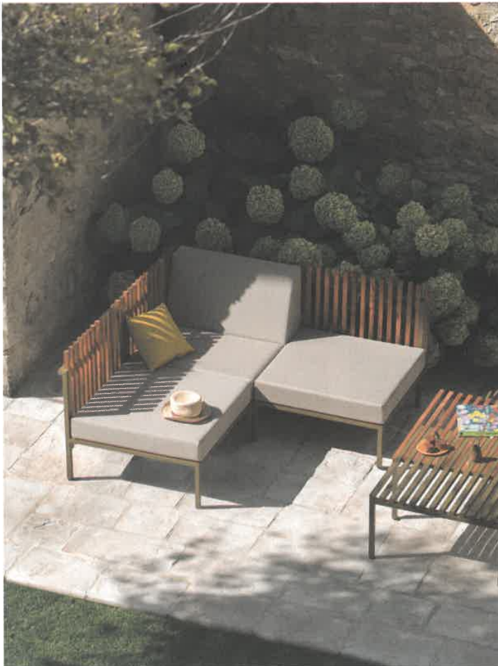
4 EGO PARIS

5 Les tissus serpentent dans une structure aluminium légère. Les tressages et les cannages jouent aussi subtilement des codes in/outdoor pour démontrer l'inventivité en termes de design et savoir-faire du territoire de l'outdoor. Serpentine Collection de Cinna