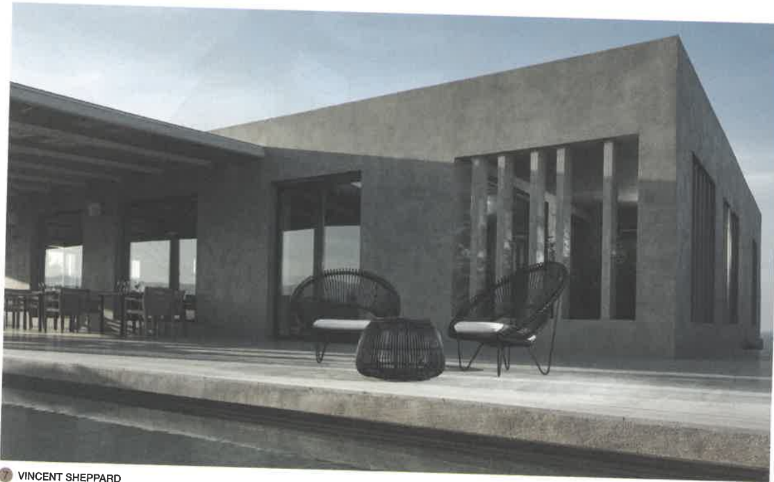
7 VINCENT SHEPPARD

7 En extérieur, rien n'est figé, tous les designs sont dans la nature pour offrir plus de souplesse dans l'aménagement. Le vintage fait volontiers un clin d'œil au contemporain. Fauteuil Roy Cocoon Black de Vincent Sheppard