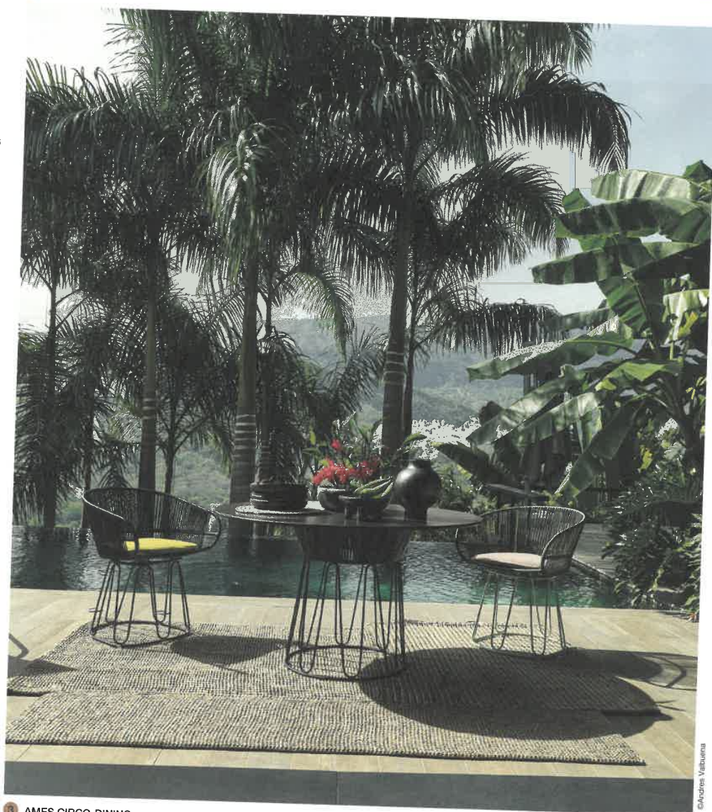
3 AMES CIRCO-DINING

2 La piscine doit s'adapter à toutes les clientèles en travaillant ses jeux de profondeur, ses aménagements extérieurs et son équipement pour une approche ludique. Hôtel Ikos Dassia en Grèce, zone de jeux d'eau pour enfants.