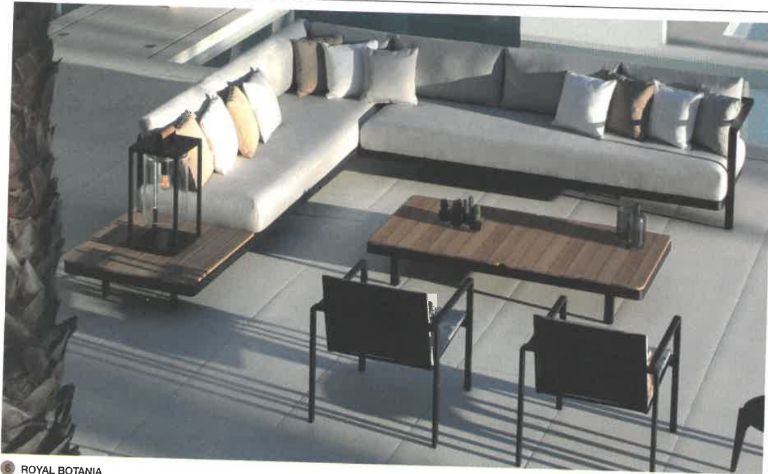
6 ROYAL BOTANIA

6 Mixer les éléments apporte modernité et personnalisation aux aménagements extérieurs d'où de larges gammes élaborées pour jouer de leur complémentarité. Collection Alura et Alura Lounge de Royal Botania