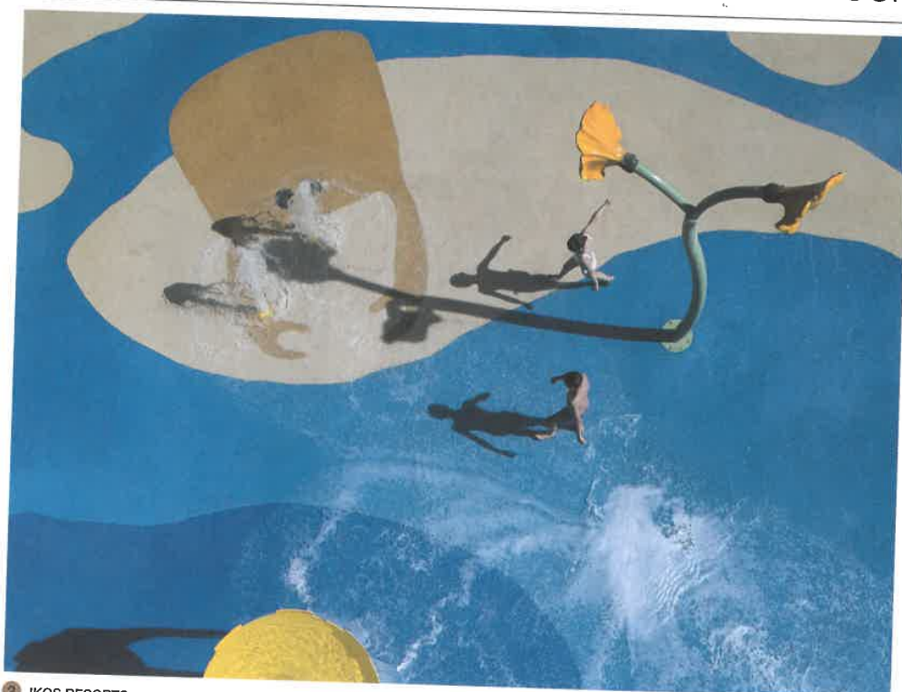
2 IKOS RESORTS

De façon globale, l'extérieur est le prolongement naturel de l'intérieur. Dans cette optique, les sols opèrent la même gymnastique de continuité, à valider dans la dimension de leur format, le sens de leur calepinage et leur unité colorielle, ce qui n'empêche nullement de faire cohabiter certains matériaux. Il en est de même pour l'intégration esthétique de la piscine avec les matériaux de sa plage (avec margelles intégrées ou non) à mettre en adéquation avec son environnement immédiat et dans l'harmonie des autres espaces extérieurs. On privilégiera donc plus volontiers des matériaux robustes dits neutres de type grès cérame, pierre naturelle (granit de Chine, pierre de Hainaut, marbre de travertin, etc.) ou béton, plébiscités pour leur facilité d'entretien, leur authenticité ou leur modernité, contrairement à la matière vivante du bois jugée putrescible et sujette au développement d'un biofilm. S'il trouve sa place en terrasse, le bois nécessite une approche tout en finesse quant à l'acceptation de son aspect final, à savoir sa patine grise. À l'extérieur, la recherche d'ambiances doit toujours être dictée par un souci technique. Fabriqués en fibres synthétiques, les tapis outdoor se mettent donc au diapason. Ces derniers ayant plus valeur d'éléments de décor pour structurer l'espace et s'inscrire dans la mouvance recherchée d'une ambiance lounge.